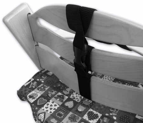
Zapnutí pultíkových kšandiček na zadní části opěrek