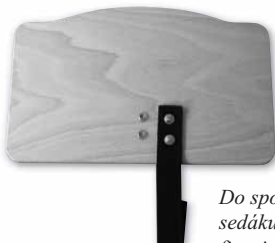
Do spodní strany malého sedáku připevníme druhy pro fixaci mezinožního pásku (MP)