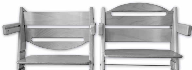
Správně umístěná zvýšená opěrka zad